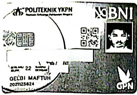
Lampiran 2: Kartu Tanda Mahasiswa